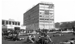
Národní práce věnovaná památce předsedy vlády Svatopluka Čechy, číslo 6. 1942, part. 6. 18, sign. 205, 220.

Firma Baťa byla vůbec první firmou u nás, která zavedla bezplatnou stravu pro dělníky pracující v době přesčasů. V roce 1904 byla osmihodinová pracovní doba. Na tehdejší poměry se jednalo o revoluční přístup k dělnictvu. Od roku 1918 byla práce přesčas zakázána.